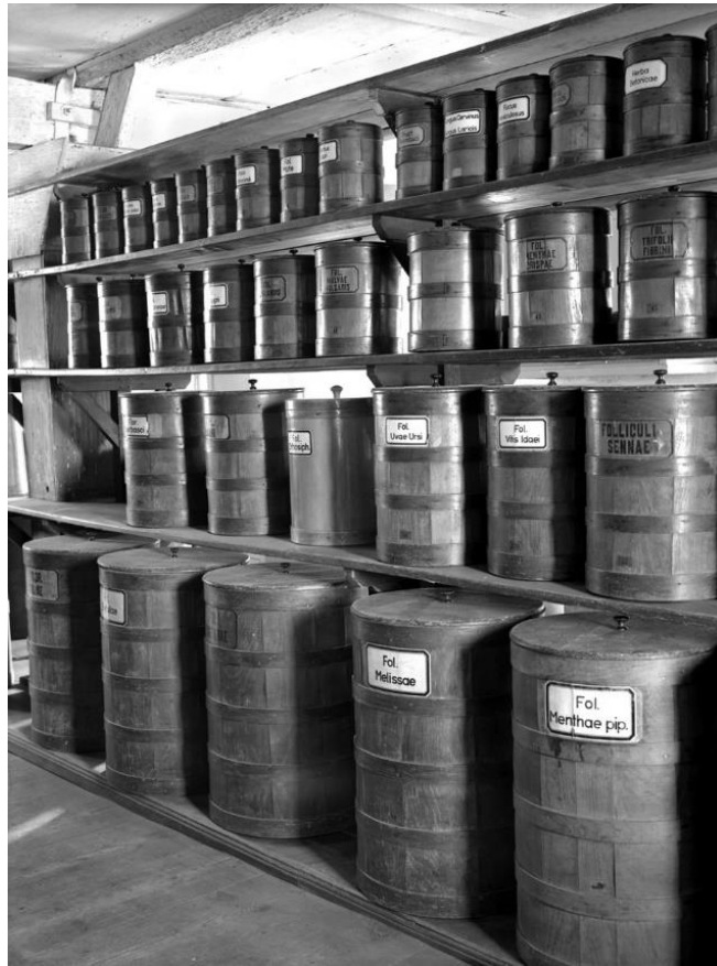
Abbildung 2: Blick in die Kräuterammer im Dachgeschoss mit Holzfässern; Coburg, Melchior-Otto-Platz; 1486/1500; Foto: Schmidt-Glassner, Helga (vor 1975)