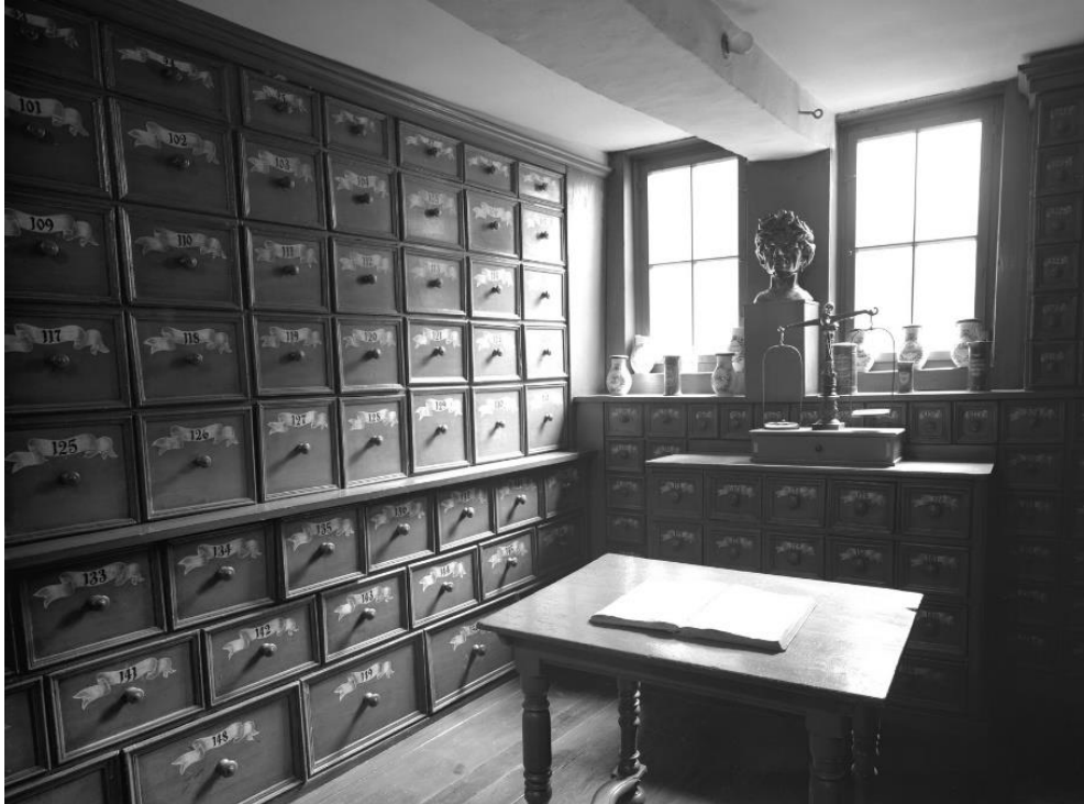
Abbildung 1: Offizin; Wetzlar, Schwarzadlergasse 2; um 1703; Foto: Schmidt-Glassner, Helga (vor 1975)

Räumen untergebracht. 11 Um die täglich anfallende Arbeit erledigen zu können, waren folgende Räume notwendig: die Offizin, das Laboratorium, die Material- und Kräuterkammer sowie der Arzneikeller. 12 In der Offizin wurden sowohl die zusammengesetzten Arzneien als auch die einzelnen Bestandteile der Rezepturen aufbewahrt. Dort befand sich auch der Rezepturtisch, an dem die Medikamente hergestellt wurden. Dieser Raum lag im Erdgeschoss des Gebäudes und verfügte über ein breites Fenster. 13 Durch diese Öffnung wurde der Kunde bedient, da das Betreten der Apotheke nicht gestattet war. 14 In dem Laboratorium wurden durch alchemistische Verfahren Arzneimittel hergestellt. Dafür befand sich in dem Raum mindestens ein Ofen, aber auch andere Wärmequellen wie beispielsweise Öllampen und Dungkästen. 15 Die Material- und Kräuterkammer befand sich meistens im Dachboden. Hier wurden in großen Schubladenschränken die Zutaten gelagert, die trocken bleiben mussten. Zudem gab es auf dem Dachboden auch Trockengestelle um die frischen Kräuter vor der Einlagerung zu trocknen. Rohstoffe, die eine kühle Lagerung vertrugen oder benötigten, wurden im Arzneikeller aufbewahrt. 16